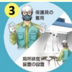
リスク低減措置の実施