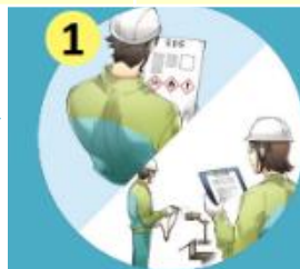
SDS及び作業現場の確認