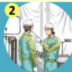
リスクアセスメントの実施