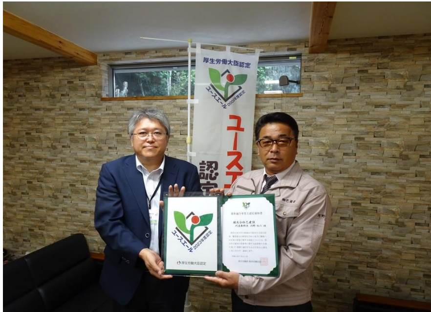
認定通知書と盾を持って撮影