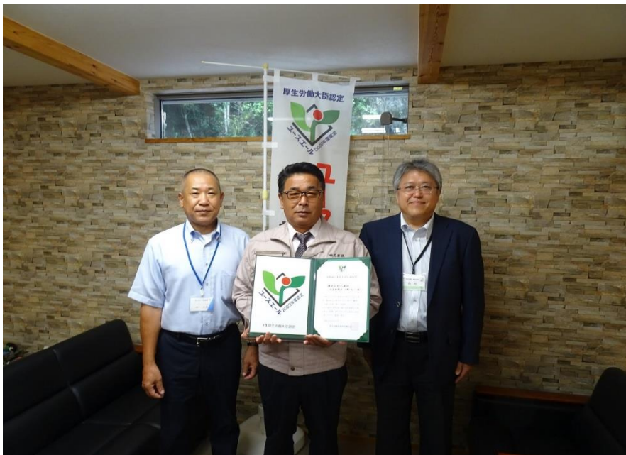
左からハローワーク多治見大澤所長、河野代表取締役、西村訓練課長