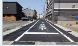
令和4年度 道路側溝改良工事