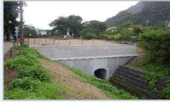
令和3年度 岐阜公園せせらぎ緑道整備工事