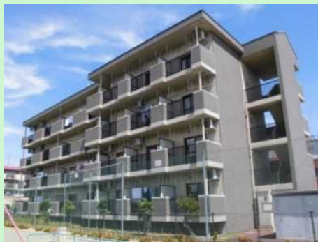
【ミレニアムハイツ】岐阜市

岐阜労働局には、岐阜市、各務原市、土岐市、高山市に単身から世帯で入居できる宿舎があり安心です。