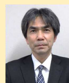
【大口 カ生 署長】

皆さんの環境整備（より快適・安全な職場づくり、より長く働き続けたいと思える職場づくり）のため日々活動しています。私たちと一緒に働いてみませんか？