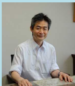
岐阜労働局長 千葉 登志雄