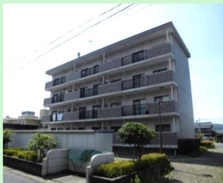
【ハローハイツとき】土岐市

徒歩圏内に、コンビニ、スーパー、ドラッグストア等があるので、不便はありません。部屋はとても広く、きれいです。通勤経路には、土岐プレミアムアウトレットや、イオンモール土岐等、有名なお店もあるため、帰り道に買い物もできます。