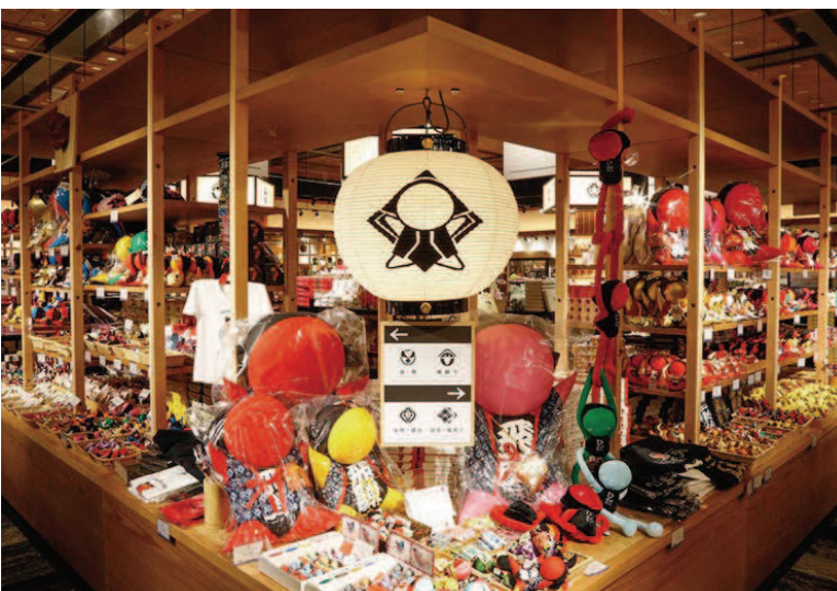
飛騨物産館（さるぼぼ展示風景）

これからも働く意欲がある高齢者が元気に働き続ける場所を提供し続け、地域の雇用創出、地域活性化にも貢献できればと思っております。