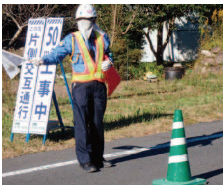
警備アルバイト (75歳)