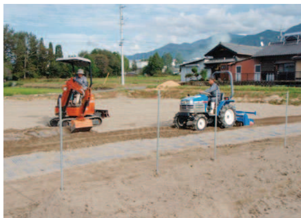
元工務部 左から：T.M (66歳)、K.K (65歳)

当社は経営の多角化により、社員の技術を生かして、地域密着をキーワードに建築から商社、製造、介護、農業など、幅広い切り口を持つことを強みとしています。地域の山、川、道路、学校、病院、住宅など地域そのものを現場とする当社は、地域の方々に信頼され共生していく以外に生きる術がありません。そのため、心の姿勢が重要と考えて前述の社是を経営理念とし、「地域になくてもならない独創的オンリーワン企業」となることを理想としています。