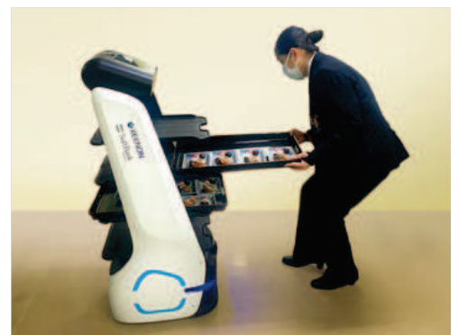
配膳ロボットの導入