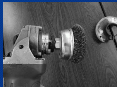
むき出しのグラインダー