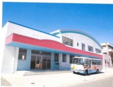
社会福祉法人 大垣和敬会 わかたけ保育園 503-0018 大垣市西之川町1丁目110 Tel.0584-73-2530 Fax.0584-73-3611