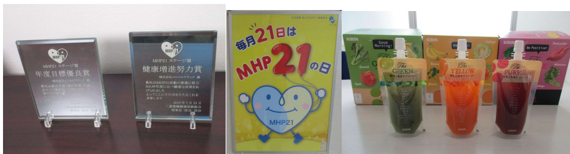
〈健康増進努力賞と年度目標優良賞のW受賞〉

毎月21日を「MHP21の日」とし、生活習慣を振り返り、一人ひとりが自らの意志によって健康維持や増進に繋がる取り組みや不摂生な生活を見直すことを推奨する日としており、1人1個スムージーを配布しています。