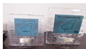
努力賞から進歩賞へ