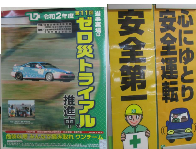
〈ゼロ災トライアルポスター、安全第一呼びかけ掲示〉