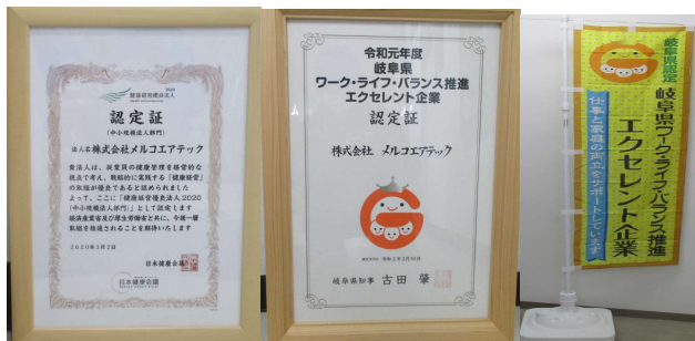
〈健康経営優良法人・岐阜県ワーク・ライフ・バランス推進エクセレント企業認定〉