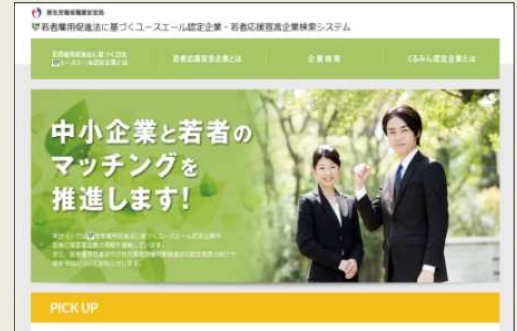
「ユースエール認定企業・若者応援宣言企業検索システム」

個別企業ごとに企業概要、雇用管理の状況、求職者に向けたメッセージなどを掲載することで、積極的な企業情報の発信と若者とのマッチングを促進していきます。