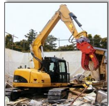
キャタピラー・ジャパン株式会社製

○ 平成26年7月1日以降は、技能特例講習を受講していないと、鉄骨切断機等の運転業務に就くことができなくなります。また、平成27年7月1日以降は経過措置の講習である技能特例講習は実施されなくなりますので、受講者が有している資格により、通常のフルの技能講習又は短縮技能講習を受講していただくこととなります。