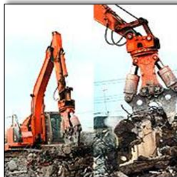
日立建機株式会社製