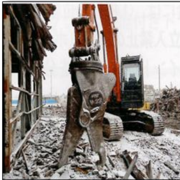
日立建機株式会社製