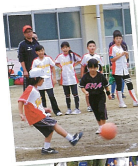
いわき市子ども会親善球技大会