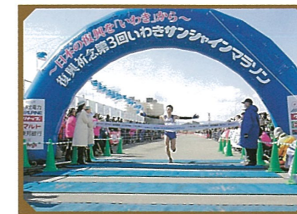
いわきサンシャイン・マラソン大会