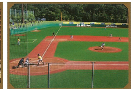
第3回 U-15ベースボール ワールドカップ2016 inいわき