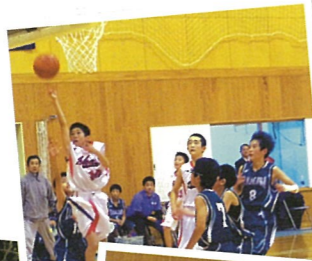
いわきミニバスケットボール大会