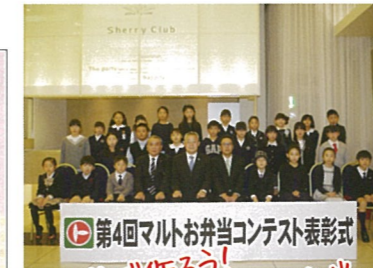
第4回マルトお弁当コンテスト表彰式 自分で作ろう！ 楽しい！美味しい！お弁当