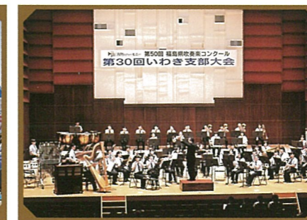
福島県吹奏楽コンクールいわき大会