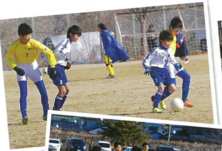
U-12いわきサッカーリーグ いわき中学生サッカーめひかリーグ