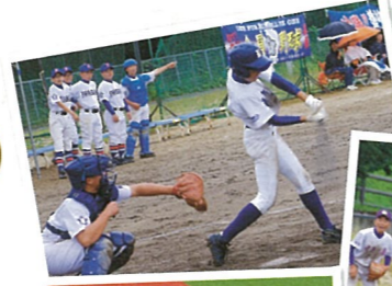
いわき市中学校野球一リーグ秋季大会