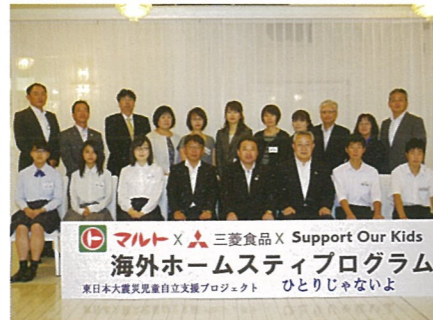
マルト × 三菱食品 × Support Our Kids 海外ホームステイプログラム 東日本大震災児童自立支援プロジェクト ひとりじゃないよ