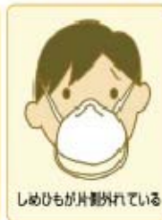
しめひもが片側外れている