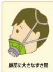
鼻周りに大きなすき間