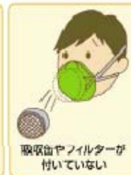
吸気口やフィルターが 付いていない