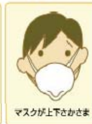
マスクが上下さかさま