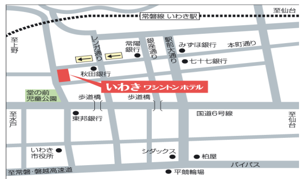
会場周辺地図(概要)