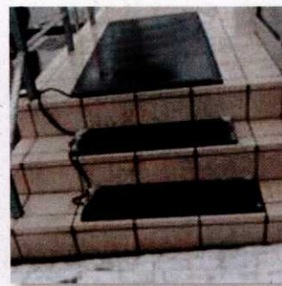
<ヒートマットの設置例>

天候による交通機関の遅れが見込まれる場合は、時間に余裕をもって出勤するようにし、落ち着いて作業をするように心がけましょう。屋外では、小さな歩幅で靴の裏全体を付けて歩くようにしましょう。