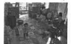
全オフィスに保育士を常駐安心してお仕事探しに専念