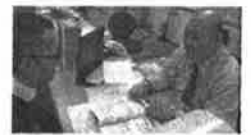
業界に精通した専任がマン・ツー・マンでサポート!