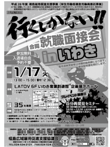
いわき会場チラシ