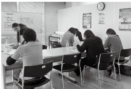
平成27年4月開催 自分「再」発見セミナーの様子

私は今まで、自分の欠点ばかりに目が向いていましたが、テスト等を受けることにより、自分の良い所に気付いたり、知らなかった自分の姿を発見できたりしました。よくわからないまま続けていた就職活動の道筋が、前よりはっきりと見えてきた気がしました。