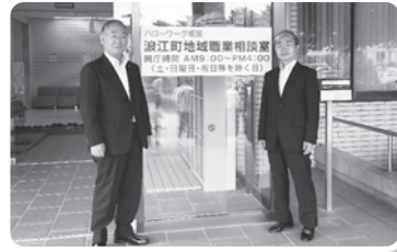
↑吉田町長(左)と岩瀬局長(右)

所在地 〒979-1513 双葉郡浪江町大字幾世橋字芋頭5-2 サンシャイン浪江内 TEL:0240-34-2416 FAX:0240-35-5218