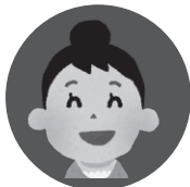
きみ 47歳 女性

就職活動がうまくいかない原因や、自分の強みもわからない状態でした。就職したいという焦りや不安もあり、頭の中が混乱している時に相談したことで、気持ちも整理できて、目標や就職活動のスケジュールを立てることができました。