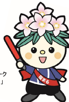
福島労働局職業安定部・ハローワーク 公式マスコットキャラクター「福まる」

※先着順となります。ご希望の時間帯に予約ができない場合もございますので、予めご了承ください。