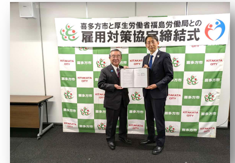
● 5/8（金）喜多方市役所 雇用対策協定締結式の様子 左：遠藤忠一喜多方市長 右：岡田直樹福島労働局長

今後、喜多方市と福島労働局（会津若松公共職業安定所喜多方出張所）においては、若年の地元就職促進及び職場定着支援、人材確保対策の実施、多様な働き手の参画支援、魅力ある職場づくりの推進等について、効果的かつ効率的な連携により推進し、持続可能な活力ある地域経済の実現を目指してまいります。