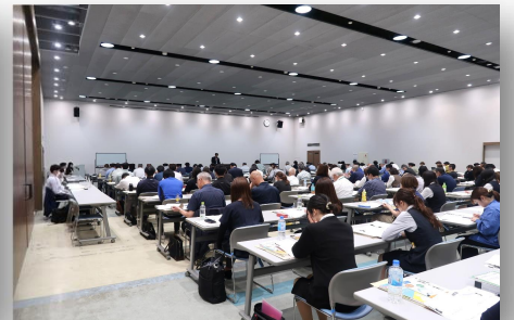
● 令和8年5月20日（水）に開催した新規高卒者等求人受理説明会の様子（153社参加）