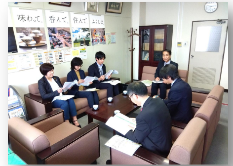
● 4/23（木）会津若松市との運営協議会の様子

協議会では、「令和7年度事業実施報告」及び「令和8年度事業計画（案）」について協議を行い、今年度においても、引き続き「若年者の就職支援及び地元定着の促進」や「人材不足分野に対する雇用支援の拡充」等の取組を実施していくことを確認しました。