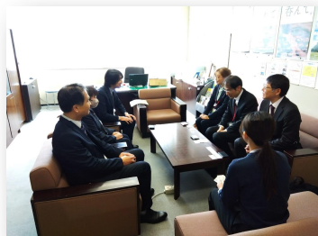
● 4/3（金）ハローワーク会津若松・所長室にて ポリテクセンター会津様との意見交換