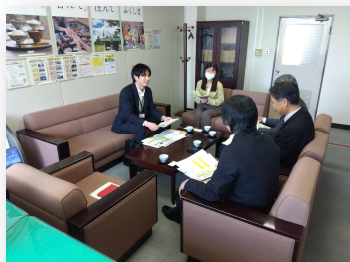
● 4/8（水）ハローワーク会津若松・所長室にて 会津若松市役所 観光商工部 商工課 商工労政グループ様との情報交換