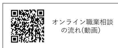
オンライン職業相談 の流れ(動画)