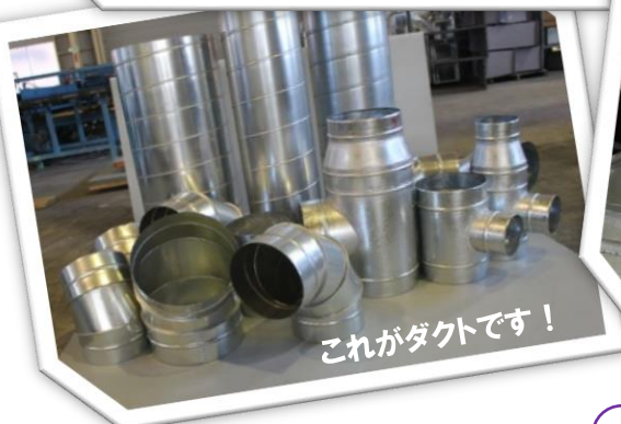
これがダクトです！