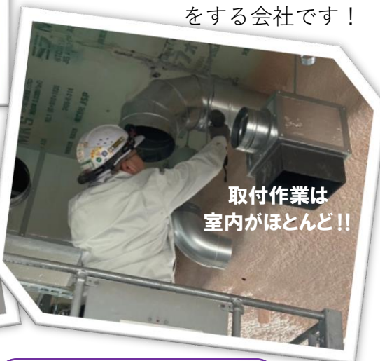
取付作業は 室内がほとんど!!