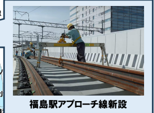
福島駅アプローチ線新設