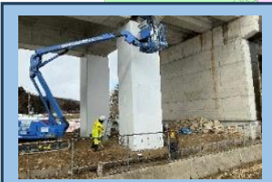
新幹線ラーメン橋台耐震補強