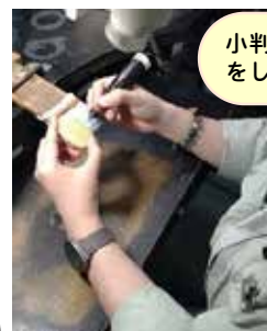
小判の仕上げ作業 をしています。

社員のワークライフバランスを重視し、残業時間を最小限に抑え、有給休暇の取得を奨励しています。ユースエール認定企業として、若者の成長と必要資格の取得を全力でサポートし、キャリアアップを促進! 創造力と挑戦心を大切にしている職場です。