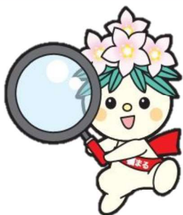
福島労働局職業安定部・ハローワーク 公式マスコットキャラクター「福まる」