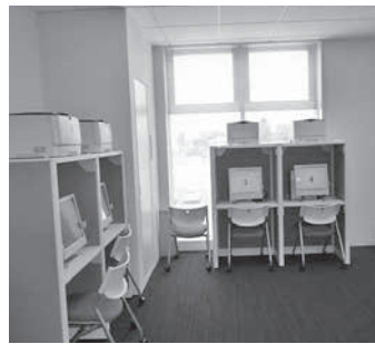
求人情報を検索できる自己検索機4台を設置。