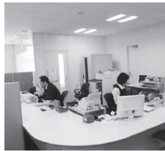
専任の相談員2名による、職業相談・職業紹介。