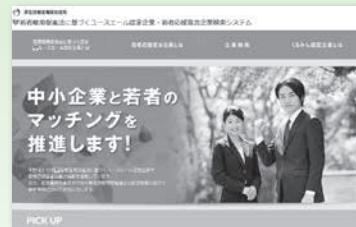
「ユースエール認定企業・若者応援宣言企業検索システム」

URL：https://www.wakamono-saiyou-ikusei.go.jp/search/service/top.action