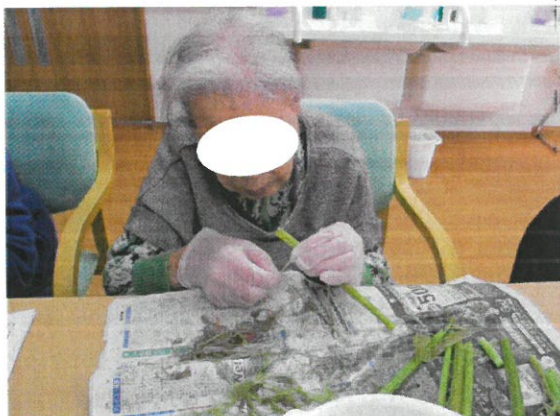
7キの下ごしらえをして下さってます