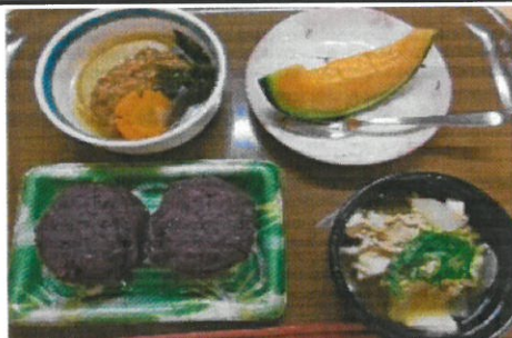
誕生日にはみんなでお祝いです