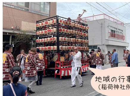
地域の行事参加 (稲荷神社例大祭)