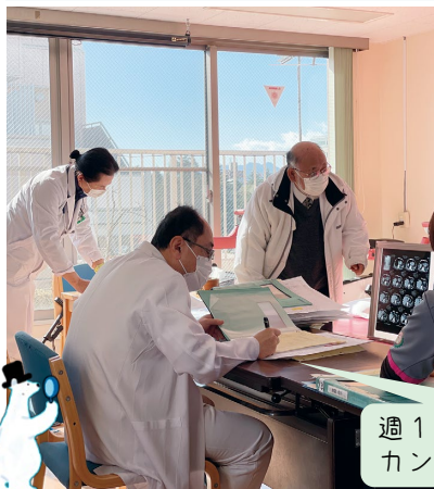
週1回行われる多職種連携 カンファレンスの様子