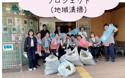
年4回のクリーンアップ プロジェクト (地域清掃)