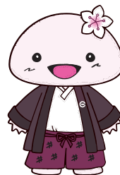
葛尾村のイメージキャラクター「しみちゃん」

葛尾村は、昨年の4月に村制施行100周年の節目を迎えました。100年の歴史は、大正・昭和・平成から令和へ、20世紀から21世紀へと変わり、それぞれの時代の幾多の困難を乗り越え、この記念となる節目を迎えることができました。これまでそれぞれの時代を懸命な努力により創り上げてこられた先人のご尽力や、村民の皆様をはじめ、多くの皆様に支えていただきましたことに、心より感謝申し上げます。