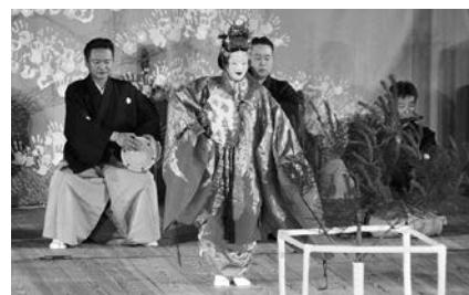
村制施行100周年記念公演 能「羽衣」より

震災後、村は、『葛尾村復興計画』を策定し、村内の生活環境整備や営農再開、企業誘致等復旧・復興に取り組んできましたが、帰還率は3割に留まっており、また、全国的な課題である少子高齢化など、まだまだ課題は山積している状況です。そのような中、村は昨年、今後10年間の指針として「第五次葛尾村振興計画」を策定いたしました。この計画により、「自然 人 温もりをむすぶ 結いのむら かつらお」を村の将来像として、「自然と共生するむら」「支え合い・助け合うむら」など5つの基本目標を定め、引き続き持続可能な村づくりを着実に推進して参る所存です。