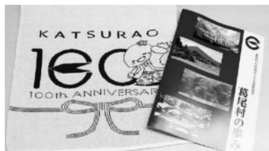
村制施行100周年記念品のタロルと記念冊子「葛尾村の歩み」

現在、村内では産業団地の整備により、新たな特産品を目指すエビの養殖が始まったほか、データセンターなどの立地も予定されています。また、大規模肥育素牛生産施設や農業用倉庫・水稻育苗施設などの整備が進み、県道50号線沿いには切れ目なく稲作が再開され、「ふるさとかつらお」の里山風景が戻りつつあります。その風景を後ろに自転車公道ロードレース「ツール・ド・かつらお」、秋には大なべや新そばを振る舞う「かつらお感謝祭」などが開催されています。葛尾村は今後