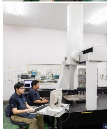
検査: 三次元測定器