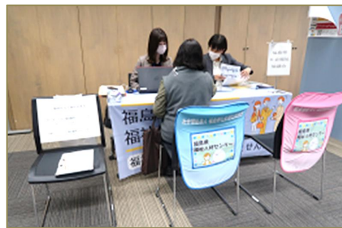
福島県社会福祉協議会の相談ブースも