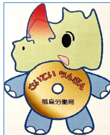
オリジナルマスコット：さいちゃんくん

新たな福島県最低賃金の発効日以降、求人申込の際には賃金の下限額が新たな最低賃金を下回らないようお願いいたします。また、地域別最低賃金が順次発効されることに伴い、就業場所が他労働局管内である場合においても、賃金の下限額が最低賃金を下回らないようお願いいたします。