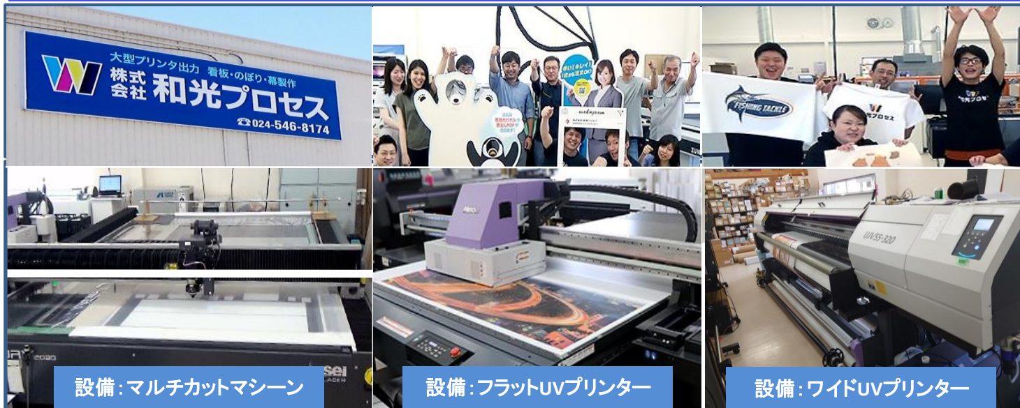
設備：マルチカットマシーン