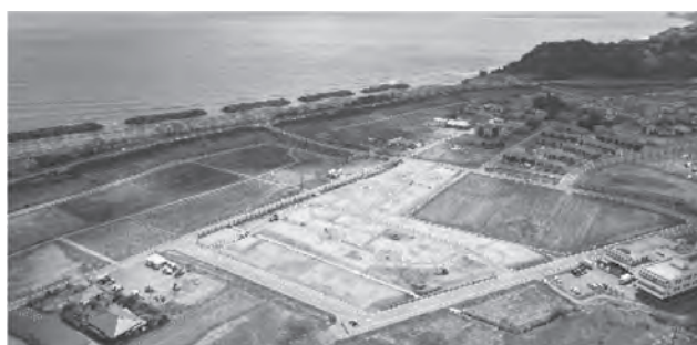
(仮称) 広野駅東ニュータウン

地域が抱えている医療・介護・福祉の様々な課題に対し、迅 速かつ適切に対応するため関係機関と連携を図るとともに、町 のみんなが相互に連携・協働しながら健康づくりの輪を広げ、 「日本一元気あふれるまち」の実現に取り組んでいきます。