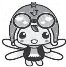
ひろはー (広野町イメージキャラクター)

JERA広野火力発電所と広野IGCC広野火力発電所との共生を展望した脱カーボンを掲げ、再生可 能エネルギーを推進し、町内の省エネ化や脱炭素化を進めるため、再生可能エネルギーの活用を図 り、EV車等や急速充電設備の設置、水素・アンモニアの社会利用モデルの構築に取り組み、2050 年のカーボンニュートラルの実現を目指します。