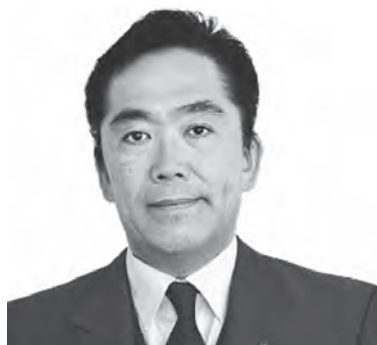
遠藤 智 町長

東日本大震災並びに原子力災害から今日に至るまで尊い命を亡くされました方々 のご冥福をお祈りし、被災された全ての皆様に心よりお見舞い申し上げます。