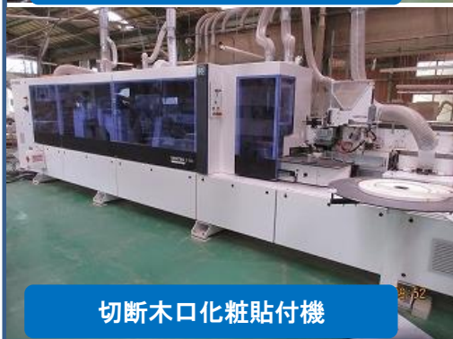
切断木口化粧貼付機