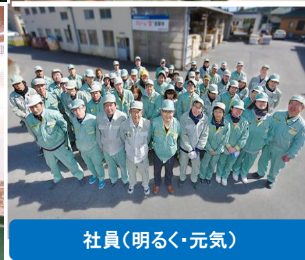
社員(明るく・元気)