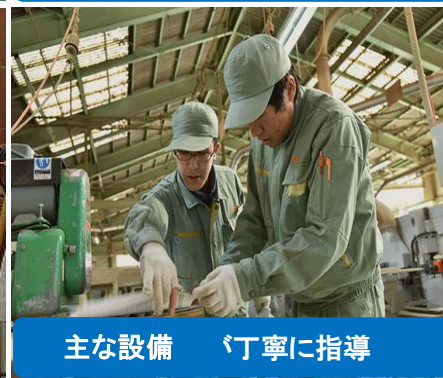
主な設備 丁寧な指導