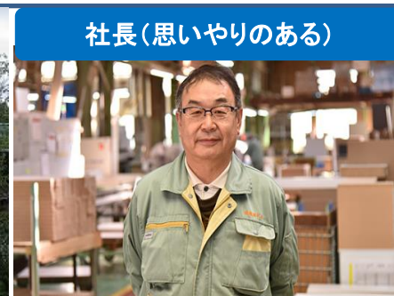
社長(思いやりのある)