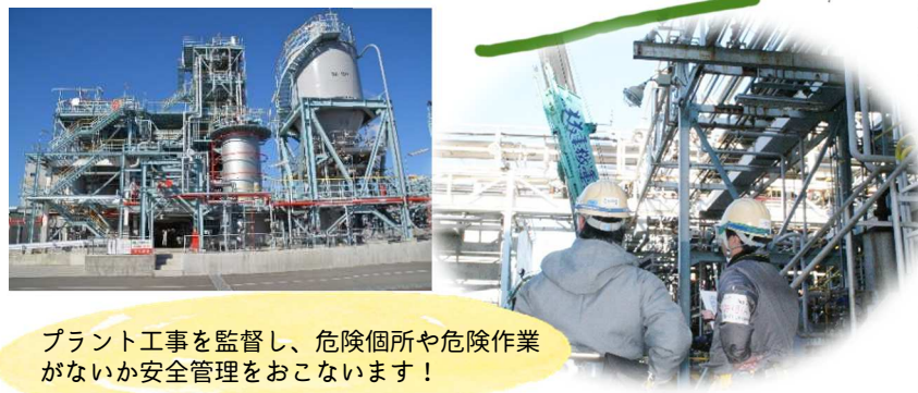
プラント工事を監督し、危険箇所や危険作業がないか安全管理をおこないます！

個人の能力に応じた教育制度の更なる充実です。昨年より中堅・ベテラン社員への個別教育制度をスタートさせ、教育後のフォロー体制を充実させることで、能力伸長を促進させる取り組みを行っています。