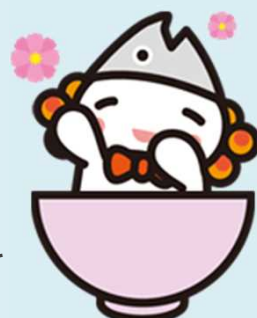
浪江町イメージアップ キャラクター「うけどん」

※浪江町地域職業相談室では、雇用保険（失業給付）や職業訓練の手続きは行っておりません。お住まいを管轄するハローワークをご利用ください。