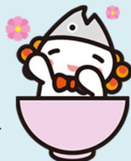
浪江町イメージアップ キャラクター「うけどん」

※浪江町地域職業相談室では、雇用保険（失業給付）や職業訓練の手続きは行っておりません。お住まいを管轄するハローワークをご利用ください。