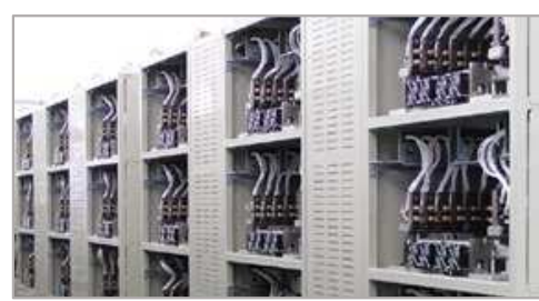
製品・充放電検査装置