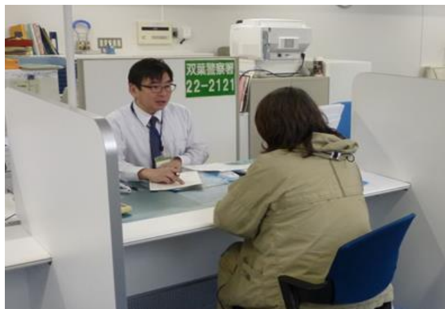
※帰町後のハローワーク富岡での相談風景