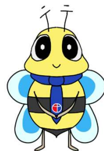
ハローワーク行橋 公式キャラクター「ゆくはちくん」