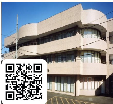
特別養護老人ホームいきいき八田