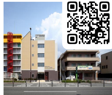
特別養護老人ホームいきいき箱崎