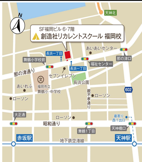
福岡市地下鉄 空港線 天神駅 西1出口から徒歩9分

※一定要件を満たせば、訓練期間中、職業訓練受講給付金(月10万円+通所手当)が支給されます。詳しくは、住所地を管轄するハローワークにお問い合わせください。 ※このコースではWindowsのPCを使用いたします。