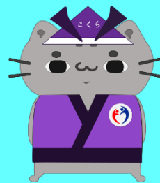
ハローワーク小倉 公式キャラクター 「こくら丸」