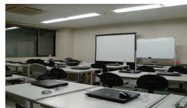
↑観光マーケティング科教室 ←天神重松ビル6階

託児サービスは別施設(中央区春吉)で行います。月齢・発育状態によってはサービスを受けられないことがありますので、申込前に委託先(株式会社ヒューリスアカデミー)に必ずお問い合わせください。 申込者多数の場合、託児サービスを受けられないこともあります。