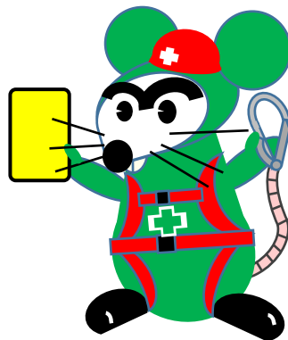
ちゅうい かんきー 注意喚起キャラ チュウ井 勘KYくん