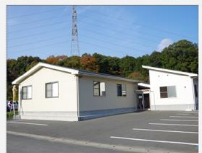
訓練実施施設外観