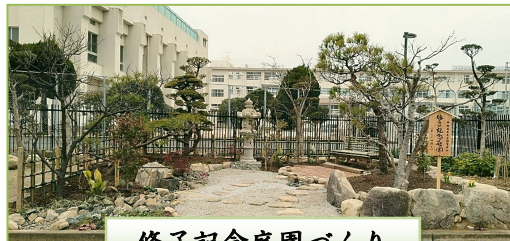
修了記念庭園づくり